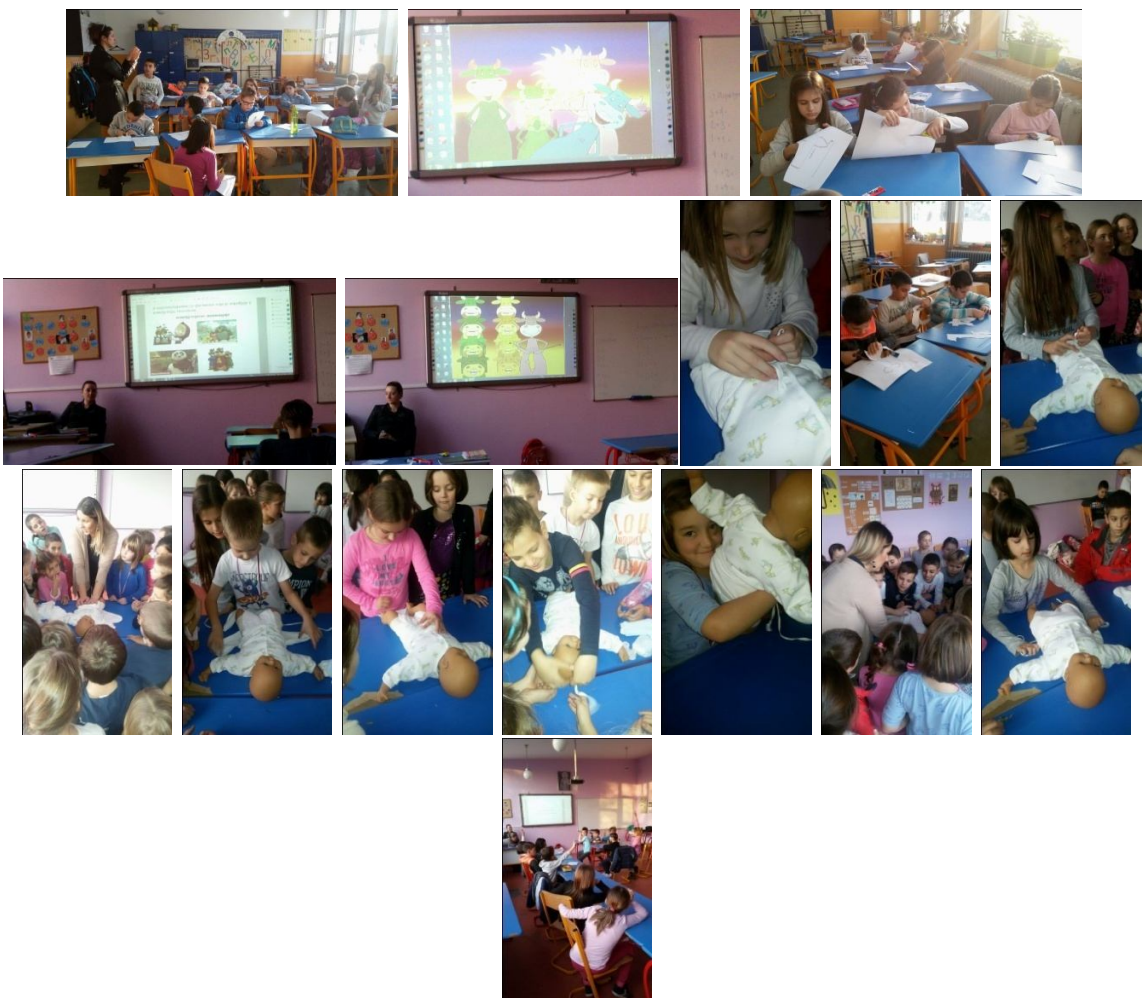
Колектив продуженог боравка